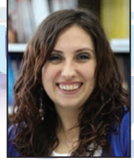
Hazırlayan: Ebru KABA

1.Dünya pazarının %1,3'ünden fazlasını hangi sektör oluşturmaktadır?