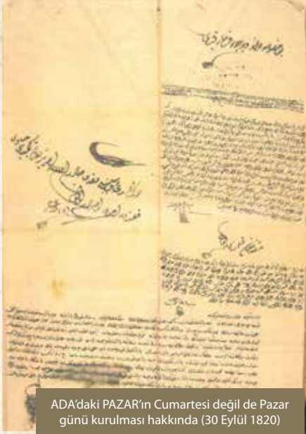
ADA'daki PAZAR'ın Cumartesi değil de Pazar günü kurulması hakkında (30 Eylül 1820)

Genivize, Şili, Yalakâbâd, Ada, İznik ve Yoros nâhiyelerinden teşekkül etmektedir. Bu tasnif Kocaeli sancağının 16. yüzyıldaki idari taksimatına da denk düşmektedir. Yine bu deftere göre İznikmid'e tabi 15 köy, Kandırı'ya tâbi 47 köy, Genivize tâbi 20 köy, Şili'ye tâbi 42 köy, Yalakâbâd'a tâbi 15 köy, Ada'ya tâbi 8 köy, İznik'e tâbi 16 köy ve Yoros'a tâbi 28 köy ve 6 mezra tespit edilmiştir. İznikmid Paşasına ve Sapanca Kadısına Nisan 1665 tarihinde yazılan bir yazıya göre Adapazarı bu dönemde Sapanca kazasına bağlı Ada Nahiyesi olarak geçmektedir.