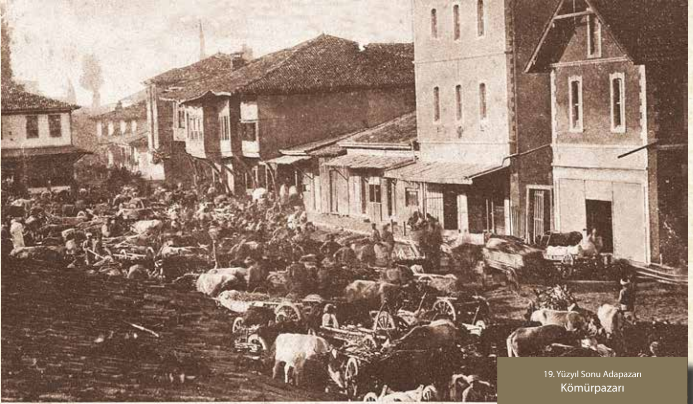
19. Y  zyıl Sonu Adapazarı K  m  rpazarı