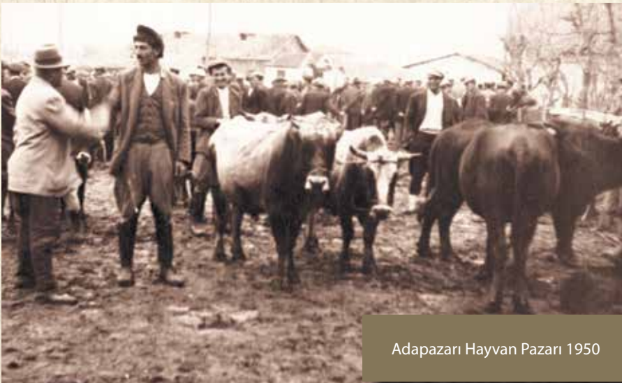
Adapazarı Hayvan Pazarı 1950