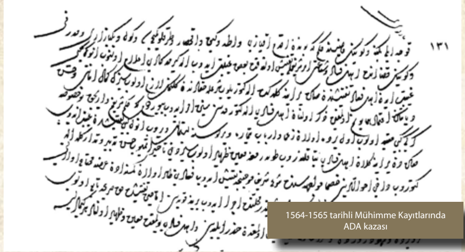
1564-1565 tarihli Mühimme Kayıtlarında ADA kazası

"Bugünkü şehrin nüvesini teşkil eden (Ada