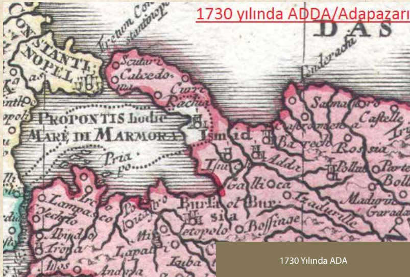
1730 Yılında ADA